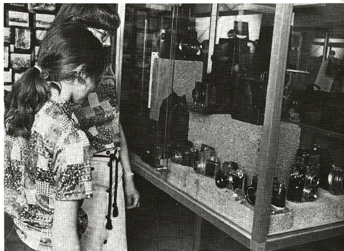
På udstillingen i Herning kan man bl.a. studere spejlflekskameraets udvikling.